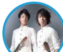
いちむじん クラシックギターデュオ

「龍馬伝」のテーマ曲を演奏した「いちむじん」のスペシャルコンサートも開催します。